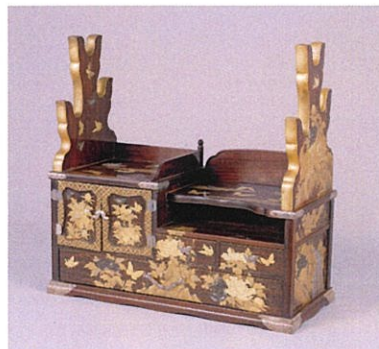
紫檀唐獅子牡丹蝶蒔絵刀掛 江戸時代 19 世紀 徳川家慶（12 代将軍）下賜・ 徳川慶勝（尾張家 14 代）拝領 徳川美術館蔵