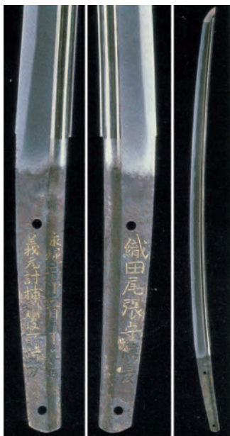
重要文化財 刀 金象嵌銘 永祿三年五月十九日義元討捕刻彼所持刀 織田尾張守信長 名物 義元左文字 京都市・建勲神社蔵 展示期間:後期