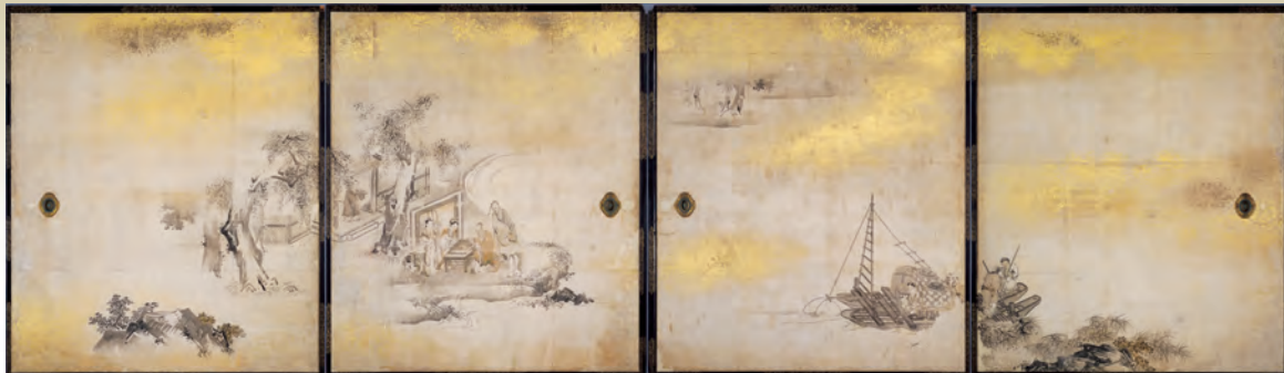
重要文化財 名古屋城本丸御殿上洛障壁画「琴棋書画図(棋図)」 名古屋城総合事務所蔵 展示期間:前期