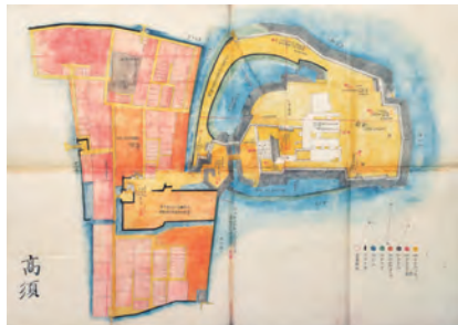
高須城図(明治五年陸軍省城絵図の内) 群馬県・しらかば古地図と城の博物館 富原文庫蔵