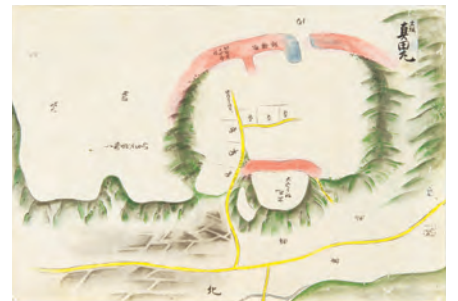
大坂真田丸図(極秘諸国城図の内) 島根県・松江歴史館蔵 展示期間:7/15(土)~8/13(日)