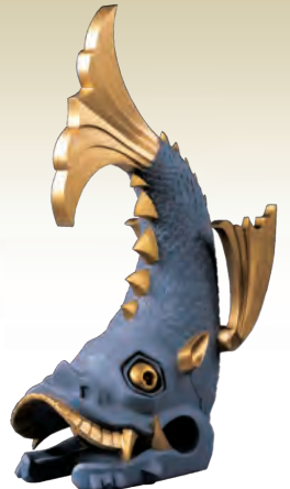
安土城伝米蔵跡出土金箔鯱瓦(復元) 滋賀県教育委員会蔵