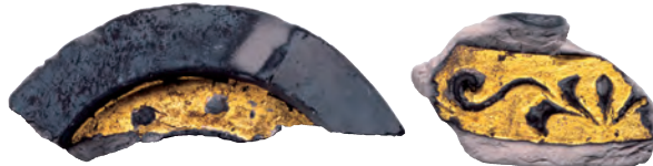
金箔瓦片(安土城搦手道湖辺部出土) 滋賀県教育委員会蔵