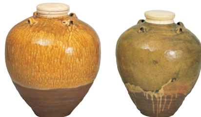
重要文化財 唐物茶壺 銘 松花(右) 唐物茶壺 銘 金花(左) 徳川美術館蔵