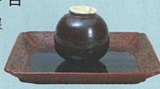
漢作茄子茶入 銘 茜屋 大名物