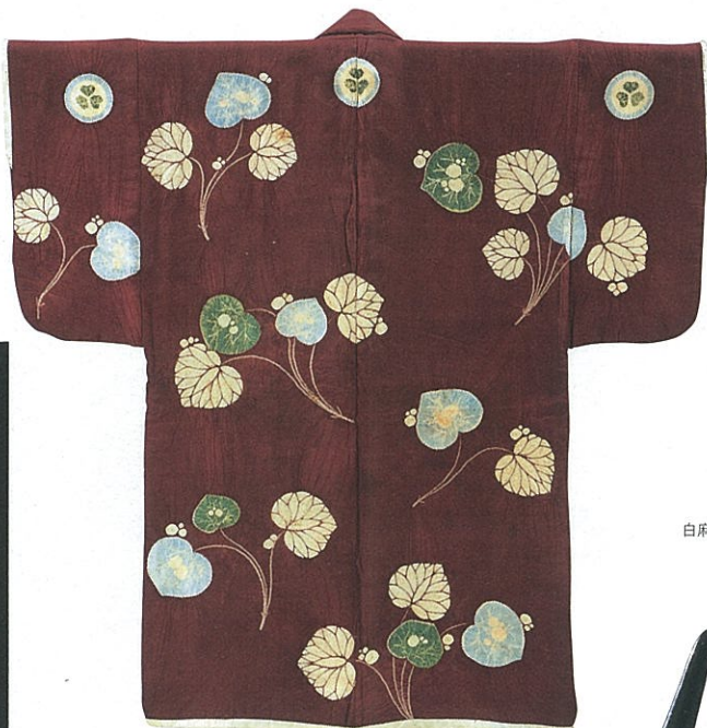
重文 紫地葵紋付葵の葉文辻ヶ花染羽織(駿府御分物) 徳川家康着用 展示期間:8/26~9/13