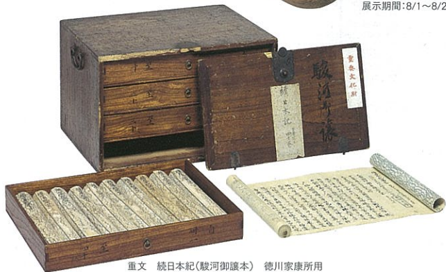
重文 続日本紀(駿河御讓本) 徳川家康所用