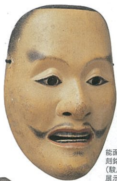
能面 平太 刻銘「慈雲院殿作」朱漆花押 (駿府御分物似寄品) 展示期間:8/1~8/25