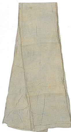
白麻地下帯[ふんどし](駿府御分物) 徳川家康着用