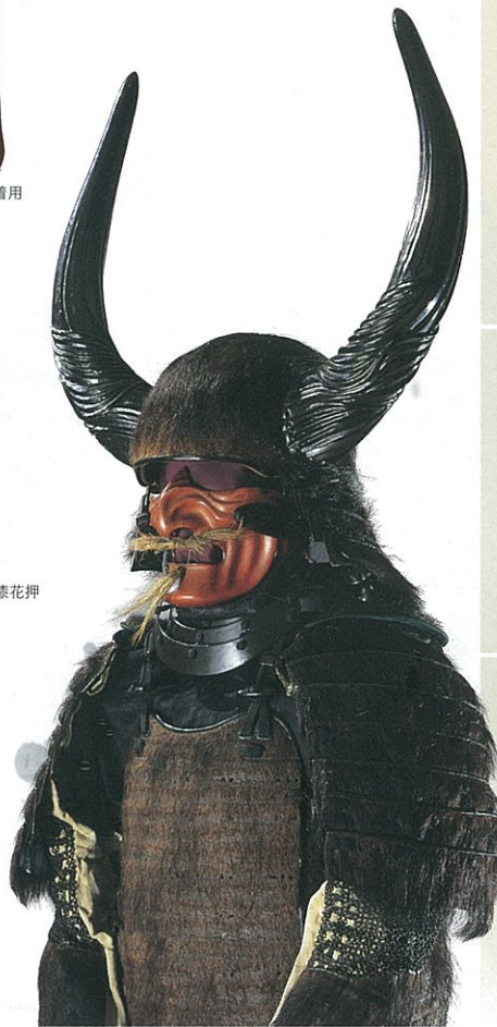
熊毛植黒糸威具足 徳川家康着用