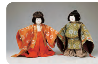
「御所人形(若君姫君)」