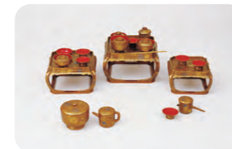
「鉄線唐草蒔絵雛道具 懸籠」