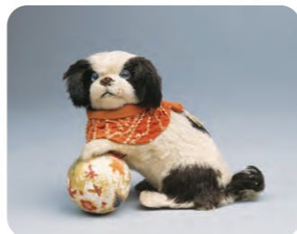
「毛植え人形 犬」 西光庵寄贈