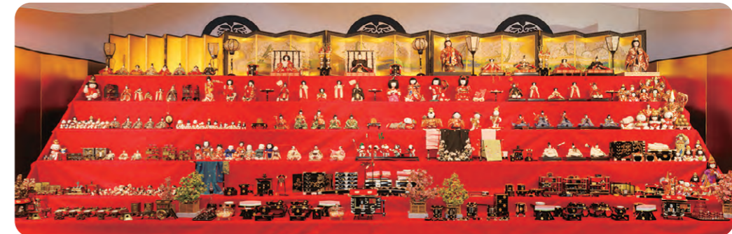
「尾張徳川家三世代の雛段飾り」