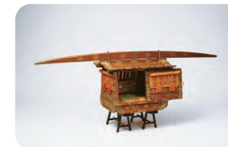
「菊折枝蒔絵雛道具 乗物」 俊泰院福君(尾張家11代齊温継室)所用