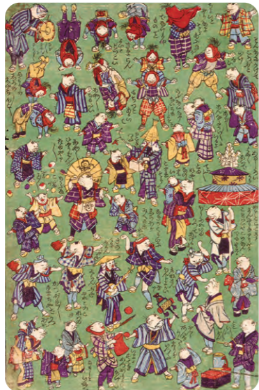
「新板猫のたわむれ」 幾英(幾飛亭)画

『枕草子』の「ちいさきものみなうつくし(小さいものはすべてかわいらしい)」の言葉に象徴されるように、古くから小さくかわいいモノは日本人の心を惹きつける要素の一つです。とりわけ、女子の身の回りの道具は、愛らしく、時に華やかに作られ、その成長と幸せを願う雛祭りにも、小さくかわいらしい品々が選ばれました。 雛祭りにちなみ、雛人形・雛道具をはじめ、抱き人形や手芸・動物など、世界を魅了する“Kawaii”品々を紹介します。