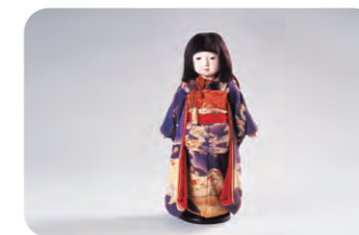
「市松人形」 瀧沢光龍斎作