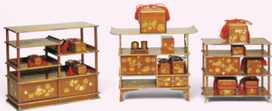
菊折枝蒔絵雛道具 三層飾り