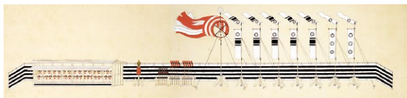
徳川直七郎節供旗飾図(展示期間:2月5日~3月4日)