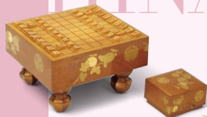
菊折枝蒔絵雛道具 将棋盤