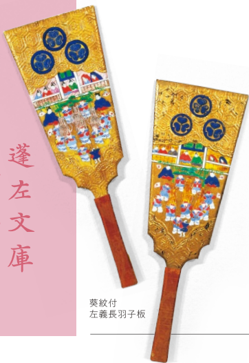
葵紋付左義長羽子板

毎年一定の時季に繰り返される年中行事は、季節の移ろいの中で人々の生活に欠かすことのできない文化・慣例として受け継がれてきました。年中行事には、上巳 じょうし の節供(雛まつり)など、現在の文化に色濃く引き継がれている行事もあれば、今では我々の生活から縁遠くなってしまった行事、あるいは変容して息づく行事などもあります。