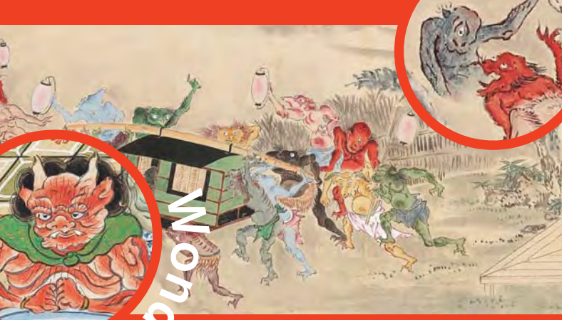
武大夫物語絵巻 三巻の内 下巻(部分) 江戸時代 十九世紀