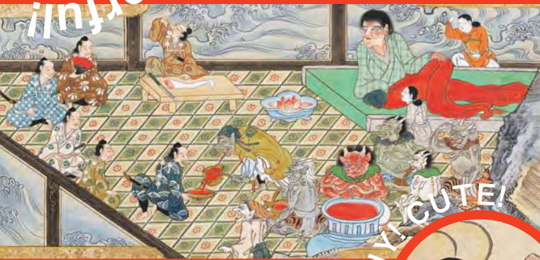
大江山絵巻(酒呑童子絵巻) 三巻の内 下巻(部分) 江戸時代 十七世紀