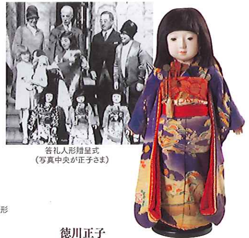
各礼人形贈呈式(写真中央が正子さま)