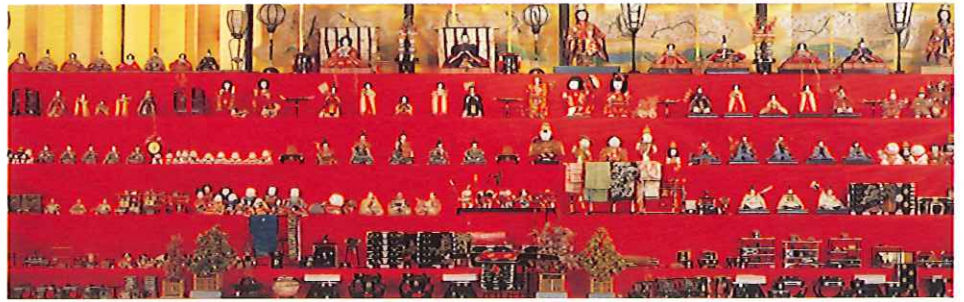
尾張徳川家三世代にわたる雛段飾り

また、所狭しとお人形や雛道具が並べられる明治・大正・昭和の雛段飾りは、およそ高さ2メートル、幅7メートルにもおよび圧巻です。大名家ならではの、豪華で気品のある雛の世界を紹介します。