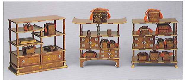
松竹梅唐草蒔絵経道具 三棚飾り 貞徳院矩短(尾張徳川家14代慶勝夫人)所用