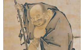
布袋図(部分) 伝狩野元信筆