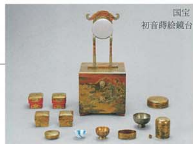
国宝 初音時絵鏡台