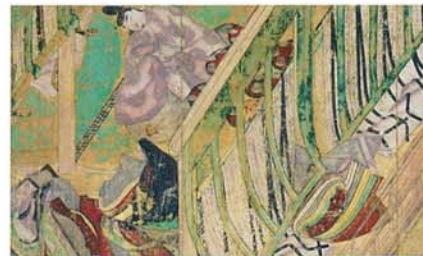
国宝 源氏物語絵巻 柏木(三)絵 部分

日時=2019年11月30日④ 午後1時30分～3時 四辻秀紀(徳川美術館 前学芸部長) ※有料(入館料別途要)