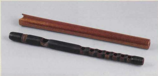
能管 瓦落 室町時代 16世紀 藤田家伝来