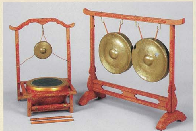
琉球楽器 銅鑼・小銅鑼・鼓 琉球王朝時代 18世紀