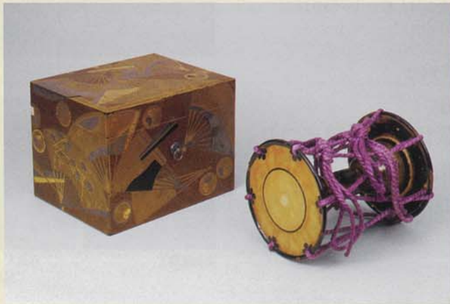
菊田時絵小鼓・葵紋扇散時絵鼓箱 小鼓 室町時代 16世紀 鼓箱 江戸時代 17世紀 豊臣秀頼・徳川義直(尾張家初代)所用