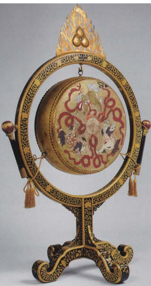
釣太鼓 江戸時代 18~19世紀

日本の古典音楽には、宮廷の式楽である雅楽をはじめ、武家の式楽である能楽、語り物の元祖である平家琵琶などがあります。笙や琵琶・箏などの楽器のなかには、インドやペルシアに起源を持つ楽器や、笛や太鼓のように形を変えながら広く普及していった楽器もあり、それぞれ歴史とともに発展しました。また、江戸時代の大名の間では能楽が必須の教養であったため、尾張徳川家でも能楽に用いられる楽器を中心に、雅楽の楽器や女性の教養であった箏・三味線、琉球王から贈られた琉球楽器一式なども伝えられました。今回の展覧会では尾張徳川家に伝わったさまざまな楽器を一堂に紹介しつつ、日本の音楽の流れを紹介します。