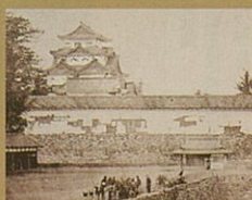
古写真「名古屋城天守」