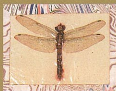
群蟲真景図(昆虫標本)