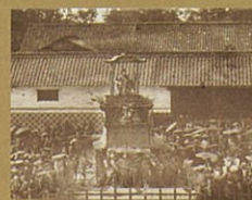
古写真「名古屋若宮祭礼」

幕府派と倒幕派、 敵味方に別れた高須四兄弟が 一枚の写真に。 それが幕末・維新という時代。