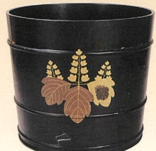
黒塗菊桐蒔絵風呂桶 伝豊臣秀吉所用 大山城白帝文庫蔵 展示期間:8/17~9/11

第95回名古屋市文化史教室 夏休み子ども歴史教室「信長・秀吉・家康」 8月2日(火)~8月31日(水)