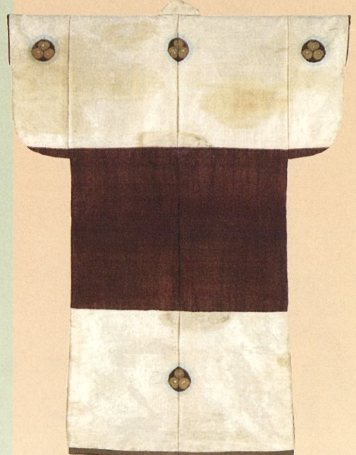
重文 白地菱紋紫腰替り辻ヶ花染小袖 徳川家康着用 徳川美術館蔵 展示期間:8/2~8/23