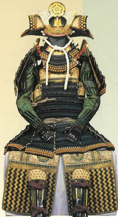
重文 紺絛威胴丸具足 織田信長着用 京都市・建礼神社蔵 展示期間:8/17~9/11