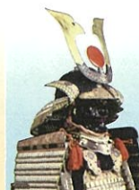
銀白糸威具足 徳川義直着用