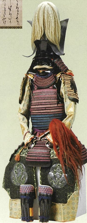
色々威二枚胴具足 伝豊臣秀吉着用 名古屋清正記念館蔵 展示期間:7/14~8/16