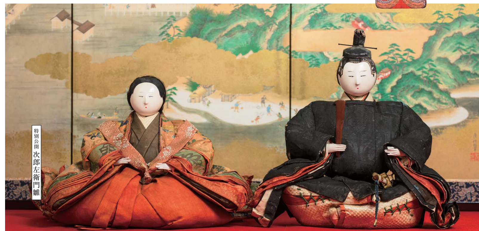
特別公開 次郎左衛門雛

江戸時代以降の町なかを飾ったお雛さまは、素朴で身近な親しみやすさがあります。本展では面長の顔の享保雛や女雛の装束に金糸や色糸を用いた豪華な古今雛、巨大な御殿を伴う御殿雛など様々なお雛さまを紹介します。また本年は町屋のお雛さまに加え、可愛らしいまん丸の顔が特徴で皇室・公家・大名家で愛された次郎左衛門雛（個人蔵）を特別公開いたします。