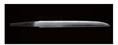
国宝 短刀 銘 吉光 名物 後藤藤四郎 重文 天皇摂関御影