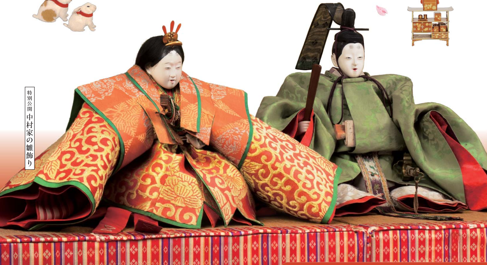
特別公開 中村家の雛飾り