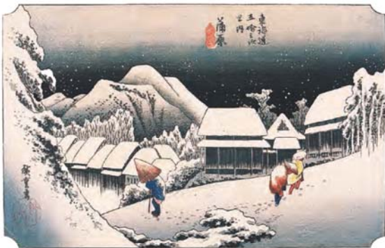
東海道五拾三次之内 蒲原 夜之雪(保永堂版)