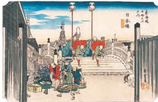
東海道五拾三次之内 日本橋 朝之景(保永堂版)