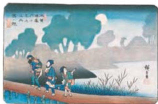
木曾海道六拾九次之内 宮ノ越