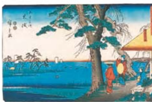
東海道 九 五十三次 大磯(隸書版)