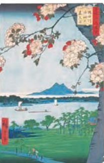
名所江戸百景 隅田川 水神の森真崎