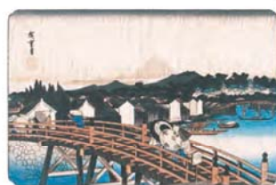
東都名所 日本橋之白雨