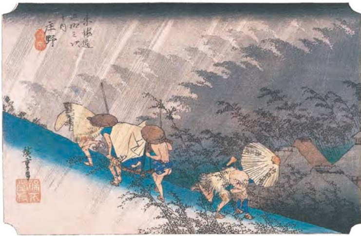
東海道五拾三次之内 庄野 白雨(保永堂版)

風景画の名手歌川広重の代表作である保永堂版「東海道五拾三次之内」全55図に加え、行書版、隸書版、縦絵東海道などの各種東海道絵や、広重のもうひとつの代表的街道絵である「木曾海道六拾九次之内」から作品を紹介します。 また、江戸や近江などの名所絵もあわせて紹介し、広重の風景画の世界をすぐれた個人コレクションとともに堪能いただけます。