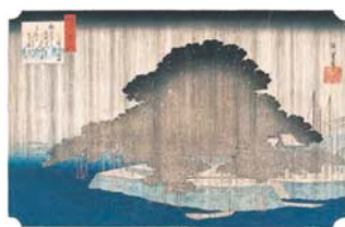
近江八景之内 唐崎夜雨