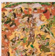
重文 豊国祭礼図屏風(部分) 岩佐又兵衛筆

祭りは宗教的行事でもあり、人々が心躍らせる娯楽でもありました。江戸時代の祭礼図を中心に、見た目にも美しく楽しい仮装や出し物に着目し、その豊富な世界を紹介します。