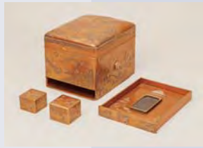
国宝 初音蒔絵旅櫛箱 (3/29~5/22)