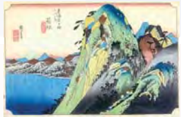
東海道五拾三次之内 箱根 湖水図 個人蔵

風景画の名手歌川広重の代表作である保永堂版「東海道五拾三次之内」全55図に、各種東海道絵や各地の名所絵を加えて紹介します。卓越した脚色の技が活かされた広重の風景画をお楽しみください。