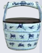
古染付手桶形水指 (5/24~8/23)