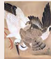
雪中鷹捉搦鶴図(部分) 狩野養川院惟信筆

飼い馴らした鷹を使って獲物を捕らえる鷹狩は、日本では古代から行われていました。鷹狩道具をはじめ、狩りに関わる人々や場にも焦点を当てつつ、鷹狩の世界を紐解きます。