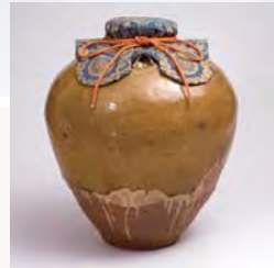
重文 唐物茶壺 銘 松花 大名物

茶の湯道具や刀剣などのうち、名の知られた由緒ある優品は「名物」と呼ばれ貴ばれました。尾張徳川家の収蔵品を中心として、名物の展開をたどりながら、名だたる名物の数々をご覧ください。