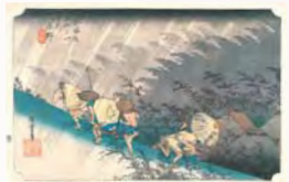
東海道五拾三次之内 庄野 白雨 個人蔵