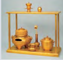
重文 純金台子茶具 (9/21~12/15)

【特別公開】 国宝 源氏物語絵巻 蓬生・柏木(二) 11/19(土)~11/27(日)