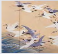
群鶴図屏風(部分) (伝狩野山楽筆「四季花鳥図屏風」裏面)

通常の展覧会ではめったに披露する機会がない作品の裏側・内側を紹介するとともに、そこに施された仕掛けと意義を考えます。また展示の裏側として、大名家の道具の収納・保管方法も紹介します。