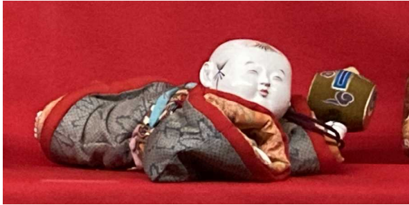
← 御所人形 ごしよにんぎょう は こ 這い子