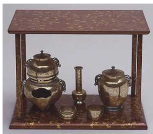
だいすかいぐ ちゃ どうぐ 台子皆具 (お茶の道具)