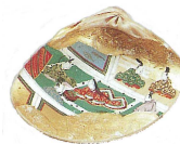
だしが い 【出貝】