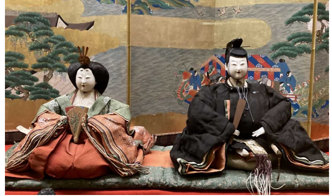
そくたいすがた 束帯姿

そくたい こうてき ぎしき とき き れいふく 【束帯】・・・ 公的な儀式の時に着る礼服