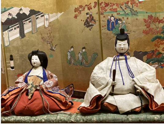
のうしすがた 直衣姿