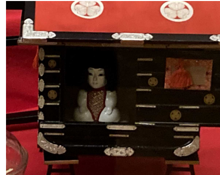
のりもの にんぎょう 乗物・人形 →