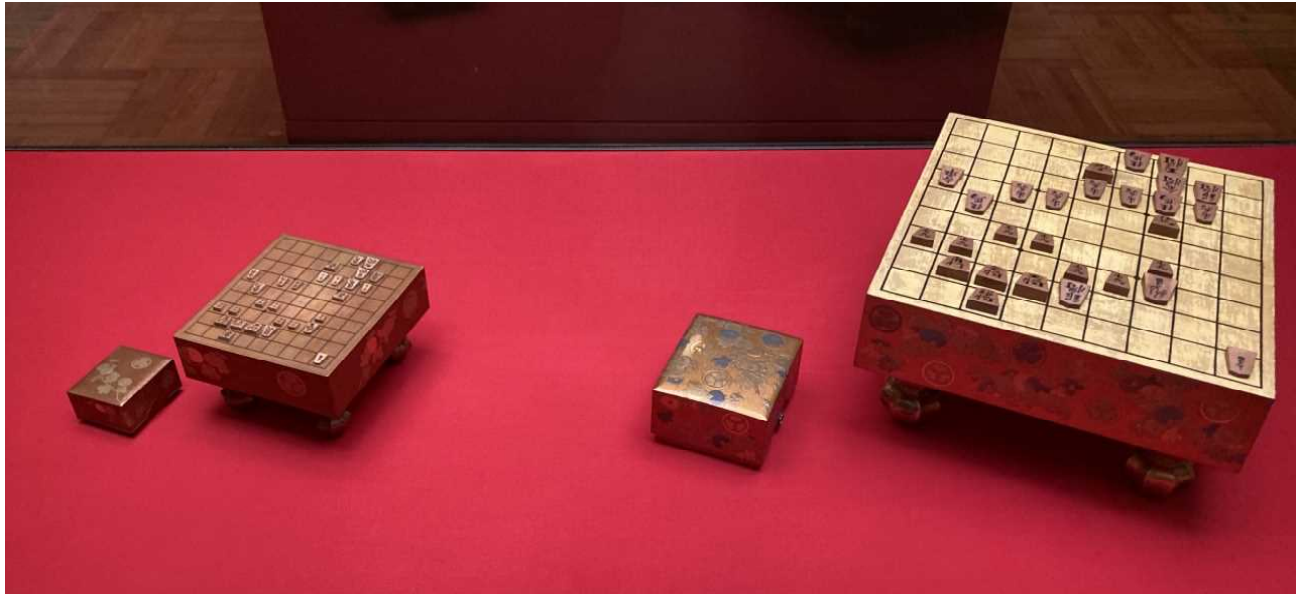
きくおりえだまきえひな どうぐしょうぎばん 菊折枝蒔絵雛道具将棋盤