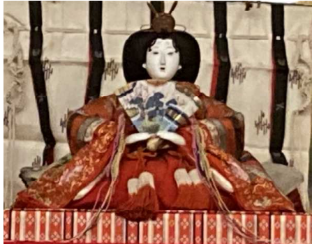
↑ ひな お雛さま