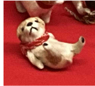
毛作り人形 → けづく にんぎょう