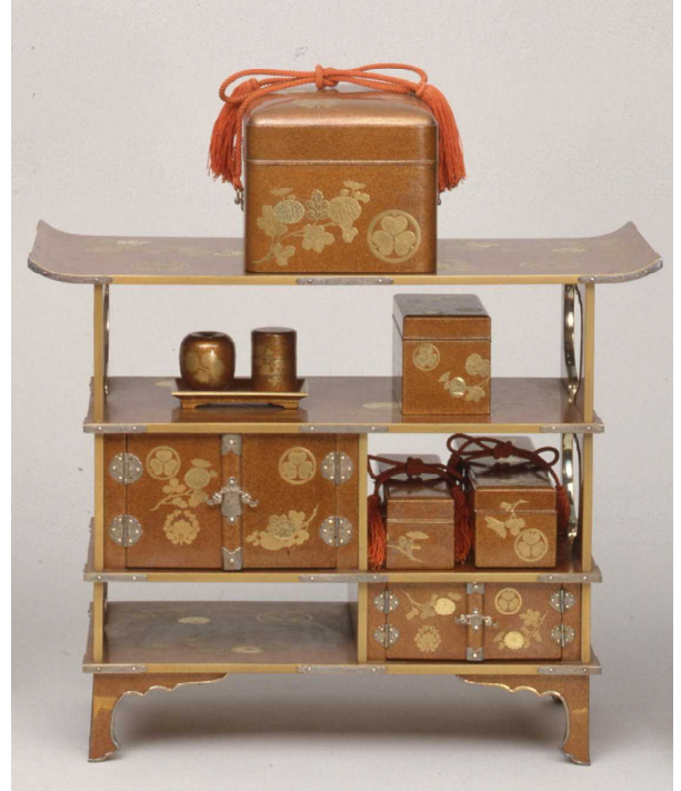
きくおりえだまきえ ひなどうぐ 菊折枝蒔絵雛道具 ずしだな 厨子棚