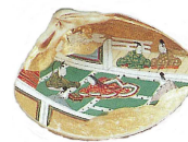
じが い 【地貝】