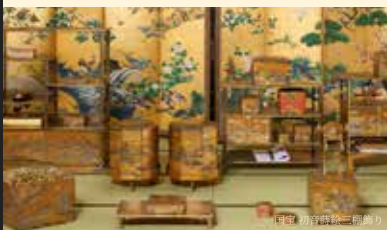
国宝 初音時給三節飾り

国宝「初音の調度」は、徳川美術館の1万件あまりの所蔵品の中でも一際、輝きを放つ、世界に誇る不朽の名品です。黄金に輝く精緻で豪華な大名婚礼調度、国宝「初音の調度」を全点一挙に公開します。