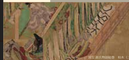
国宝 源氏物語絵巻 柏木 (二)

国宝「源氏物語絵巻」は、日本を代表する最も有名な絵巻の一つです。『源氏物語』の絵画作例として現存最古を誇り、静謐(せいひつ)な画趣の中に物語の世界観や登場人物の心理を見事に表現しています。美麗な装飾料紙に流麗な筆跡でしたためた詞書など、原作に近い時代のみやびやかな雰囲気を与え、今も見る者を魅了します。