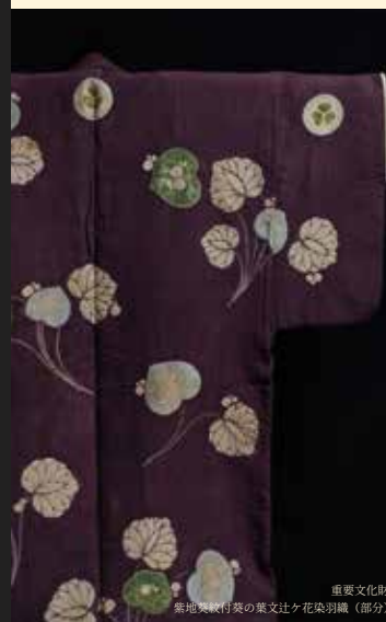
重要文化財 紫地文様付葵の葉文辻ヶ花染羽織 (部分)

本展では、重要文化財を含む名品と、昭和から令和に至る90年の歩みを物語る関連資料を通して、徳川美術館と蓬左文庫の全貌を紹介します。