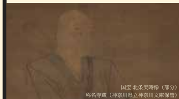
国宝 北条実時像 (部分) 称名寺蔵 (神奈川県立神奈川文庫保管)

金沢文庫は北条実時が創設した最古の武家文庫で、古典籍の宝庫として知られています。日本が世界に誇る古典籍“金沢文庫本”を有する両館が連携し、蔵書を守り伝えてきたあゆみを紹介します。