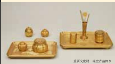
重要文化財 純金香盆飾り

3代将軍徳川家光の長女千代姫は、将軍家の跡継ぎ確保のため、わずか2歳6か月で尾張徳川家2代光友に嫁ぎました。2代にわたる将軍の姉として将軍家との橋渡し役となり、尾張徳川家の繁栄の基礎を築いた千代姫の生涯を振り返ります。