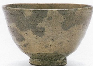
大井戸茶碗(龍光院井戸) 名物 伝千利休・津田宗及所持 朝鮮王朝時代 16世紀 大徳寺 龍光院蔵