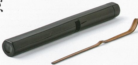
千利休竹茶杓 銘 泪 大名物 古田織部・徳川家康ほか所持 桃山時代 16世紀 徳川美術館蔵 (後期)