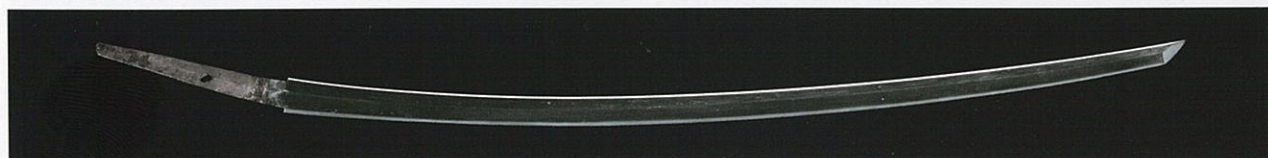
重要文化財 太刀 号 獅子王 伝源頼政・徳川家康・土岐頼次ほか所持 平安時代 12世紀 東京国立博物館蔵