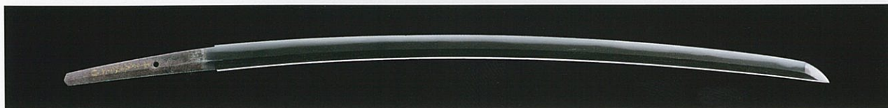
重要文化財 刀 金象嵌銘 義弘 本阿(花押) 本多美濃守所持 名物 桑名江 本多忠政(伊勢桑名藩2代)ほか所持 南北朝時代 14世紀 京都国立博物館蔵 (前期)