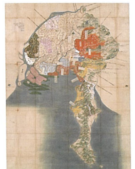
尾張家御鷹場絵図 江戸時代 18~19世紀