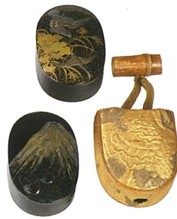
黒塗蒔絵銅合子・覆(鷹狩道具一式の内) 徳川慶勝(尾張徳川家14代)所用 江戸時代 18~19世紀

▼Twitter ごまきち タカと生き、描く。愛知県在住。著書に「鷹の師匠、狩りのお時間です1・2」(星海社COMICS)。Twitter:@outesama