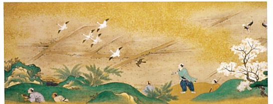
鷹狩絵巻 二巻の内 上巻(部分) 江戸時代 17~18世紀(徳川林政史研究所蔵)