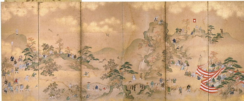
鷹狩図屏風 六曲一雙の内 左隻 江戸時代 18世紀 齊藤芳克氏寄贈