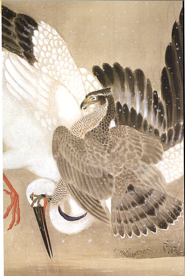
雪中鷹捉捕鶴図(部分) 狩野養川院惟信筆 江戸時代 18~19世紀