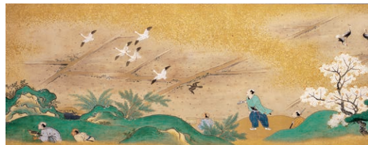
鷹狩絵巻 二巻の内 上巻(部分) 江戸時代 17~18世紀 (徳川林政史研究所蔵)