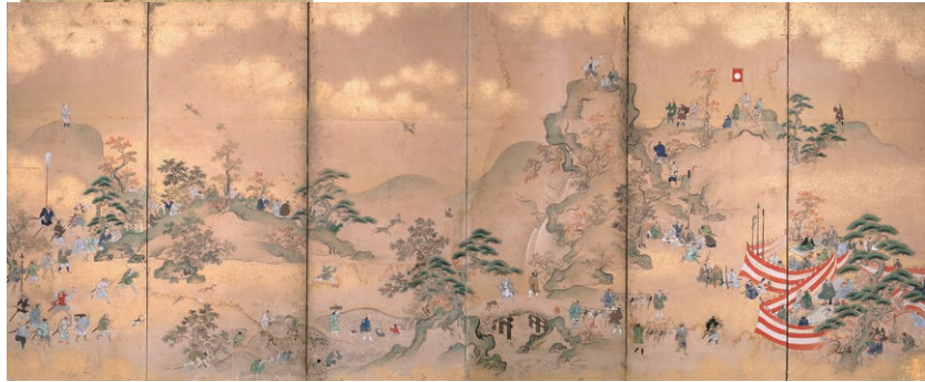
鷹狩図屏風 六曲一双の内 左隻 江戸時代 18世紀 斎藤芳克氏寄贈