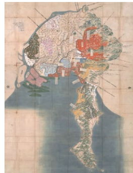
尾張家御鷹場絵図 江戸時代 18~19世紀