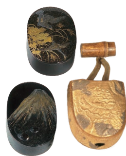
黒塗蒔絵銅合子・覆 (鷹狩道具一式の内) 徳川慶勝(尾張徳川家14代)所用 江戸時代 18~19世紀