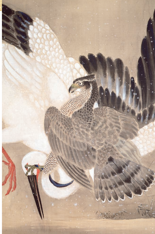
雪中鷹捉搦鶴図(部分) 狩野養川院惟信筆 江戸時代 18~19世紀

本展覧会では、鷹狩の様子を描いた華やかな屏風や巻物、鷹狩の道具を中心にご覧いただきつつ、尾張藩の鷹狩に関わった人々や場にも焦点を当て、美術作品と歴史史料の双方から鷹狩の世界を紐解いていきます。