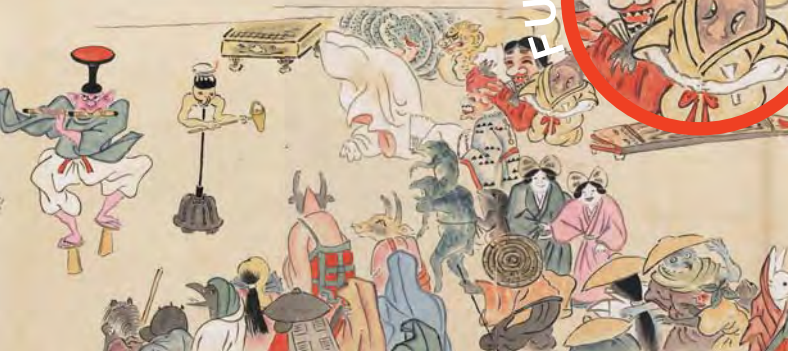
百鬼夜行絵巻 横本(部分) 江戸時代 十八~十九世紀