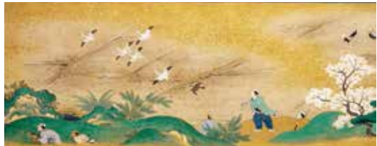
鷹狩絵巻 二巻の内 上巻(部分) 江戸時代 17~18世紀 (徳川林政史研究所蔵)