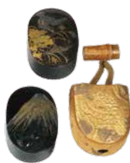
黒塗時絵銀合子・覆 (鷹狩道具一式の内) 徳川慶勝(尾張徳川家14代)所用 江戸時代 18~19世紀