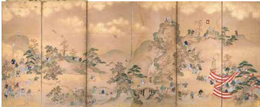
鷹狩図屏風 六曲一双の内 左隻 江戸時代 18世紀 斎藤芳克氏寄贈