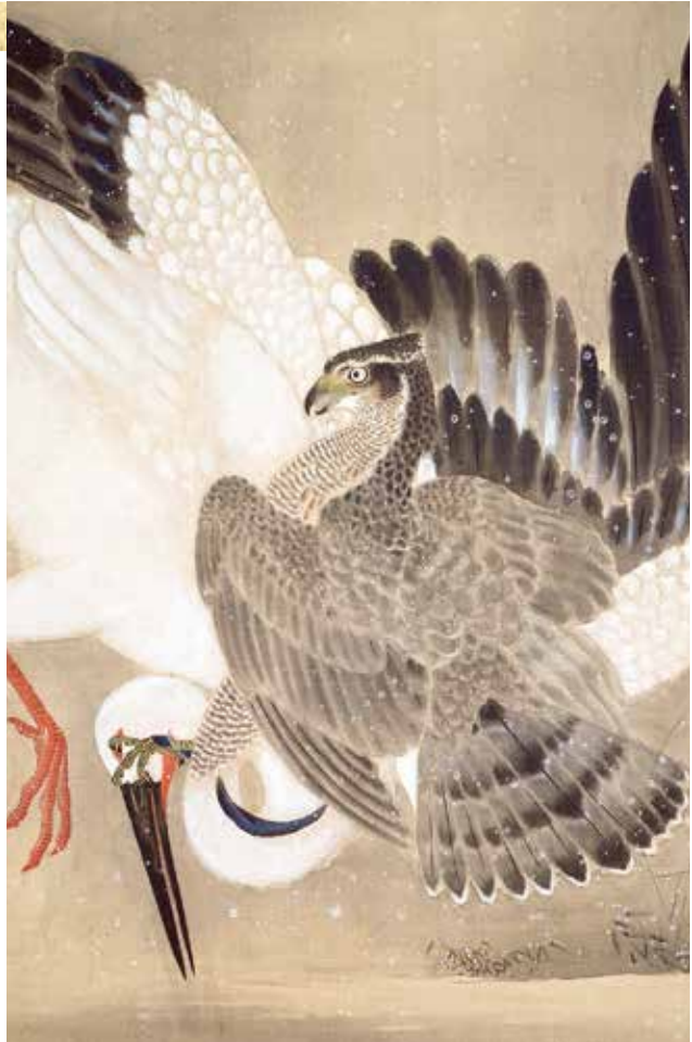
雪中鷹捉搦鶴図(部分) 狩野養川院惟信筆 江戸時代 18~19世紀