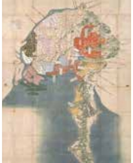
尾張家御鷹場絵図 江戸時代 18~19世紀