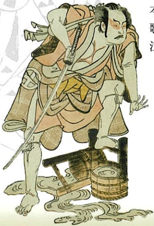
勝川春章「三代目大谷広次」

江戸の市中を活き活きと写し取った彼らの浮世絵に囲まれて、江戸を散歩してみませんか。