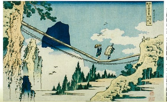
葛飾北斎「諸国名橋奇覧 飛越の堺つりはし」