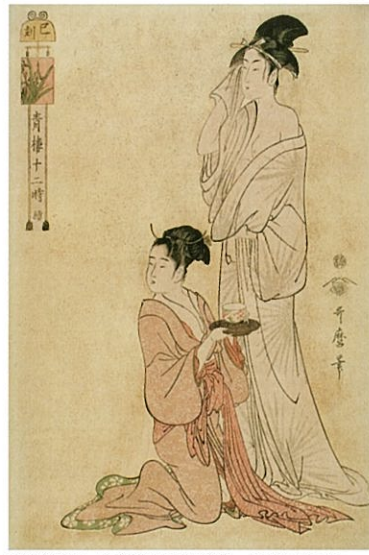
重要美術品 喜多川歌麿「青楼十二時 続巳ノ刻」