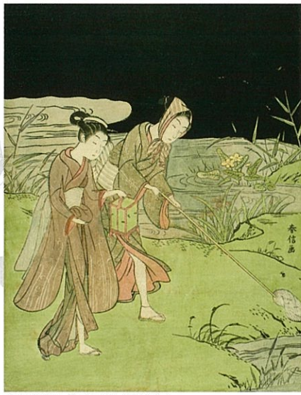
重要美術品 鈴木春信「虫狩り」