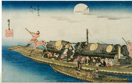
歌川広重「京都名所之内 淀川」