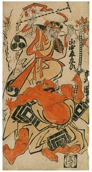
重要美術品 鳥居清信「山中平九郎 二代目市川團十郎」

平木コレクションは、実業家平木信二氏が蒐集した約6,000点にも及ぶ日本屈指の浮世絵版画コレクションです。